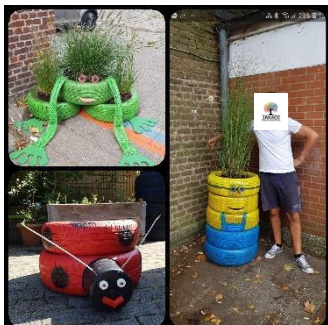
Décoration des entrées de l'école, août 2019