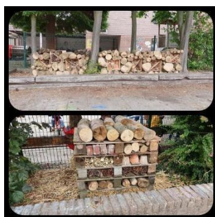
Hôtels à insectes, août 2020