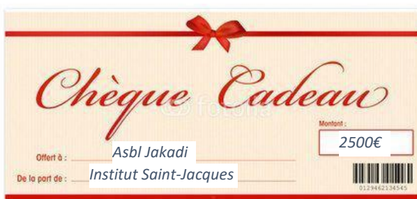
Décembre 2021, don de 2500€ à l'école