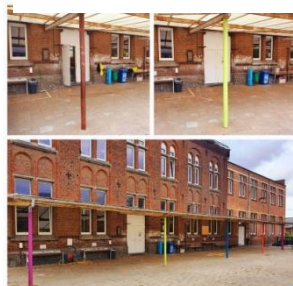
Rafrâichissement du préau des maternelles, août 2022