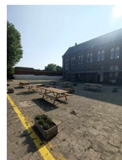
Rafrâichissement de l'espace «terrasse» des primaires, août 2024