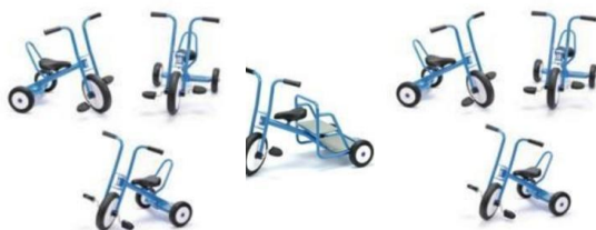
Achat de lots de petits vélos pour la cour des maternelles, août 2023

Nous sommes actuellement en train de faire réaliser un grand panneau informatif qui sera placé en bas du chemin en pavés menant à l'entrée principale afin que l'école soit plus visible de la rue Pierre Flamand.