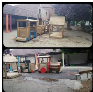
Rénovation des jeux en bois de la cour maternelle, août 2020