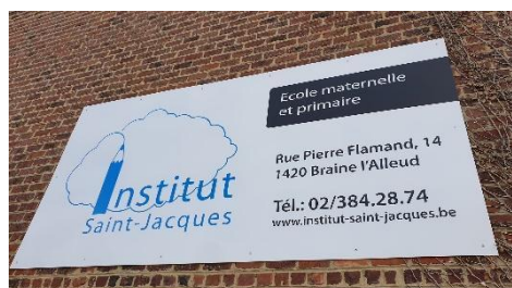
Panneau mural de 3m sur 1,5m, mars 2020