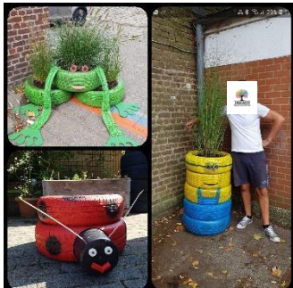
Décoration des entrées de l'école, août 2019