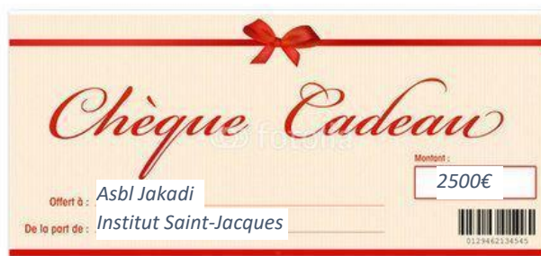
Décembre 2021, don de 2500€ à l'école