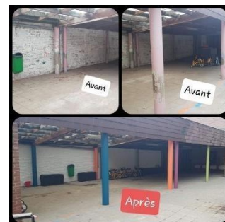
Rafrâichissement du préau des maternelles, août 2020