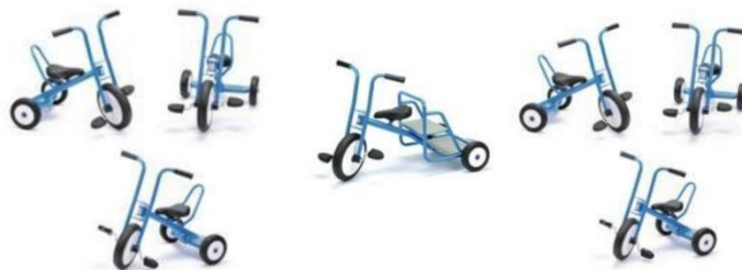
Achat de lots de petits vélos pour la cour des maternelles, août 2023