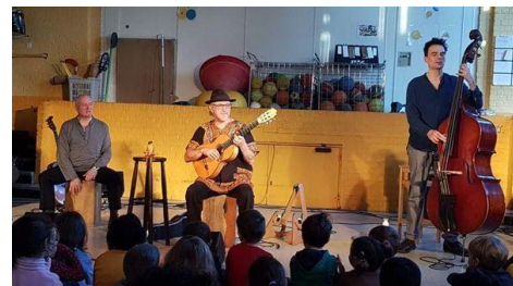
Concert de Raphy Rafaël, décembre 2019