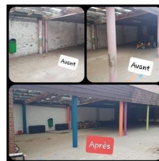
Rafraîchissement du préau des maternelles, août 2020