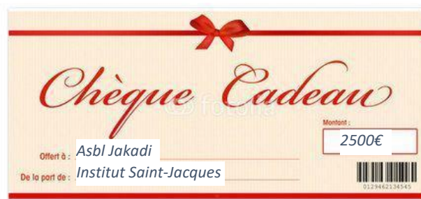
Décembre 2021, don de 2500€ à l'école