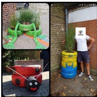
Décoration des entrées de l'école, août 2019