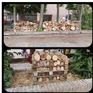
Hôtels à insectes, août 2020