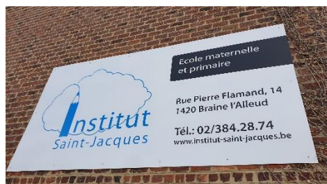
Panneau mural de 3m sur 1,5m, mars 2020