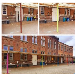
Rafraîchissement du préau des maternelles, août 2022