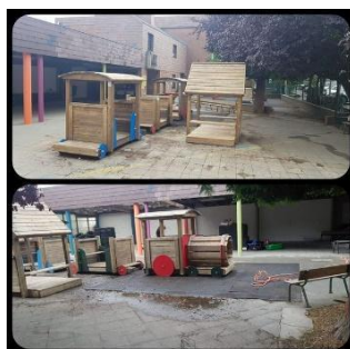
Rénovation des jeux en bois de la cour maternelle, août 2020