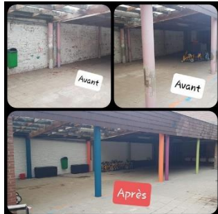
Rafraichissement du préau des maternelles, août 2020