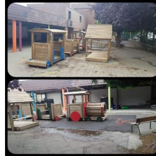
Rénovation des jeux en bois de la cour maternelle, août 2020