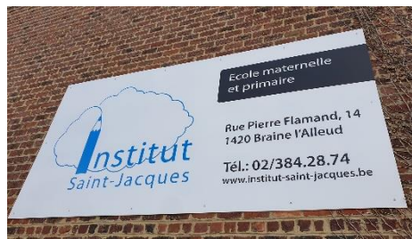
Panneau mural de 3m sur 1,5m, mars 2020