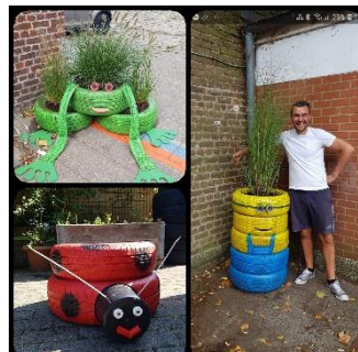
Décoration des entrées de l'école, août 2019