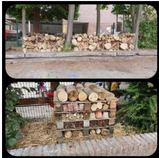
Hôtels à insectes, juillet 2020