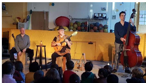
Concert de Raphy Rafaël, décembre 2019